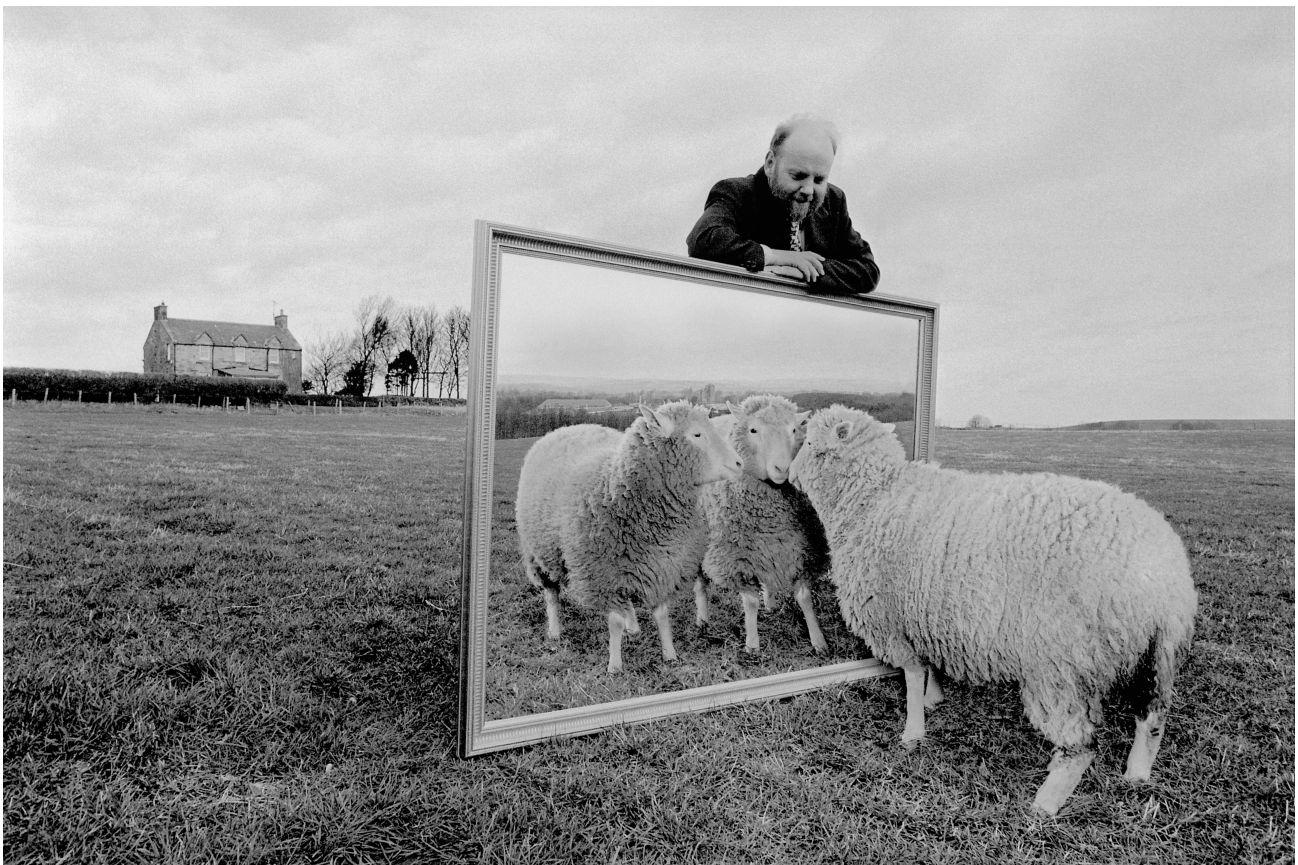
Remi Benali / Corbis (La brebis Dolly)

Cette photo est de Rémi Benali et Stephen Ferry pour l'Agence Gamma et date de 1997.