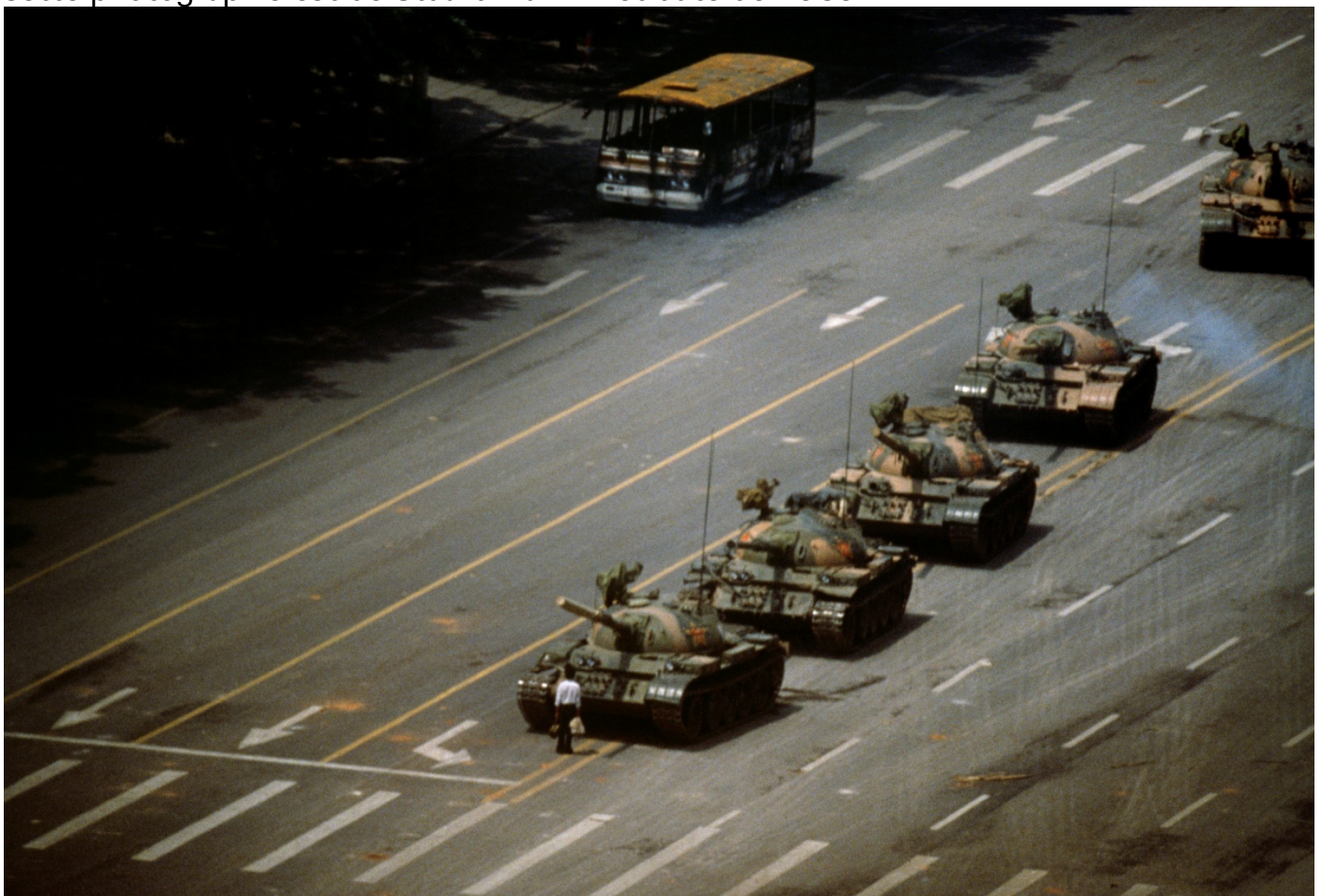
(La place Tiananmen)

Cette photographie est de Stuart Franklin et date de 1989.